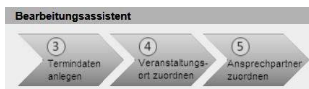
Abbildung 2: Bearbeitungsassistent Schritte 3 bis 5

Über die Schaltfläche "Neuen Termin hinzufügen" im Abschnitt "Wie/Wann/Wo (Veranstaltungstermine)" in der Datenansicht des Weiterbildungsangebotes beginnen Sie mit Bearbeitungsschritt 3 und setzen Ihre Eingabe bis Schritt 5 des Bearbeitungsassistenten fort, um eine weitere Veranstaltung zu erstellen.